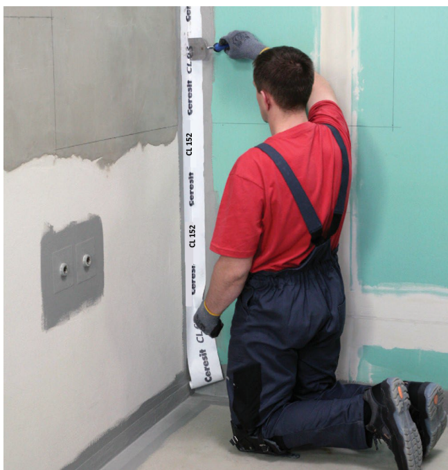
Lijepljenje brtvene trake u okomite uglove.