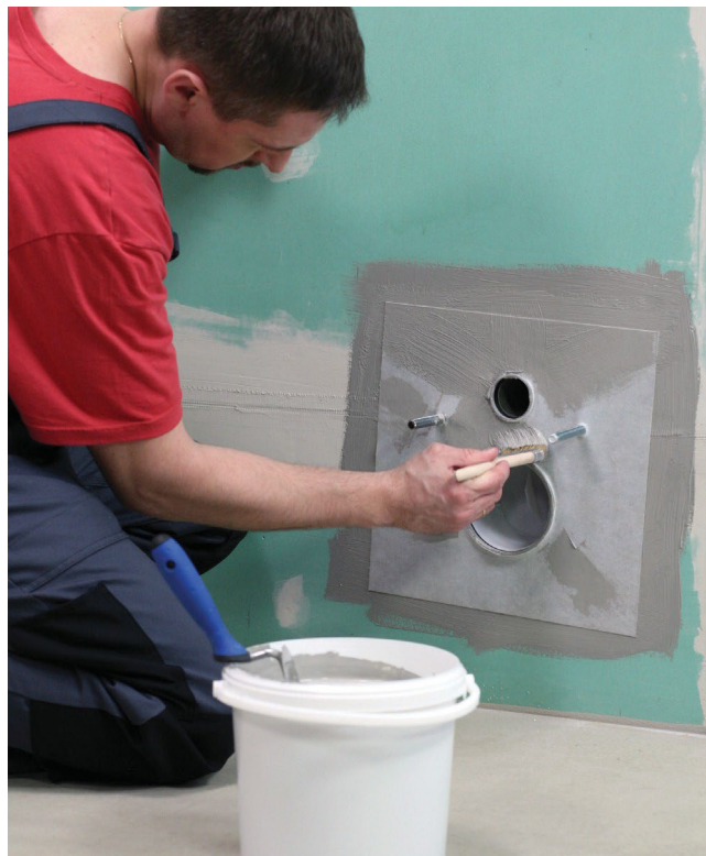
Težina lijepljenja brtvene trake ili tehničkog flisa max. 60 g/m 2 za perforacije cijevi

Prašnjave i mrvljive podloge čiste se četkom i premazuju Ceresit CT 17 pretpremazom, kao i sve upijajuće podloge. Pričekajte najmanje 2 sata nakon nanošenja.